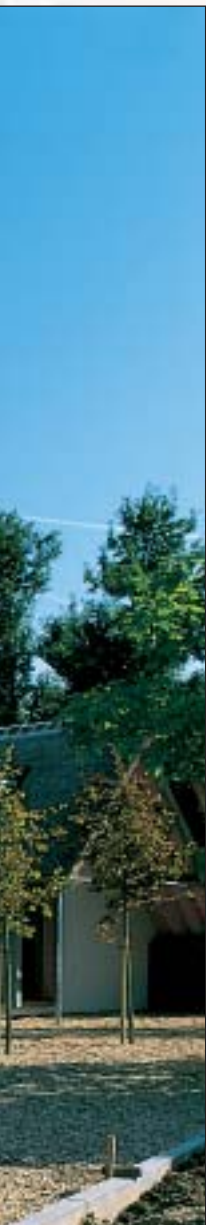
△ Links de nieuwe woonvleugel, rechts de muziekvleugel.