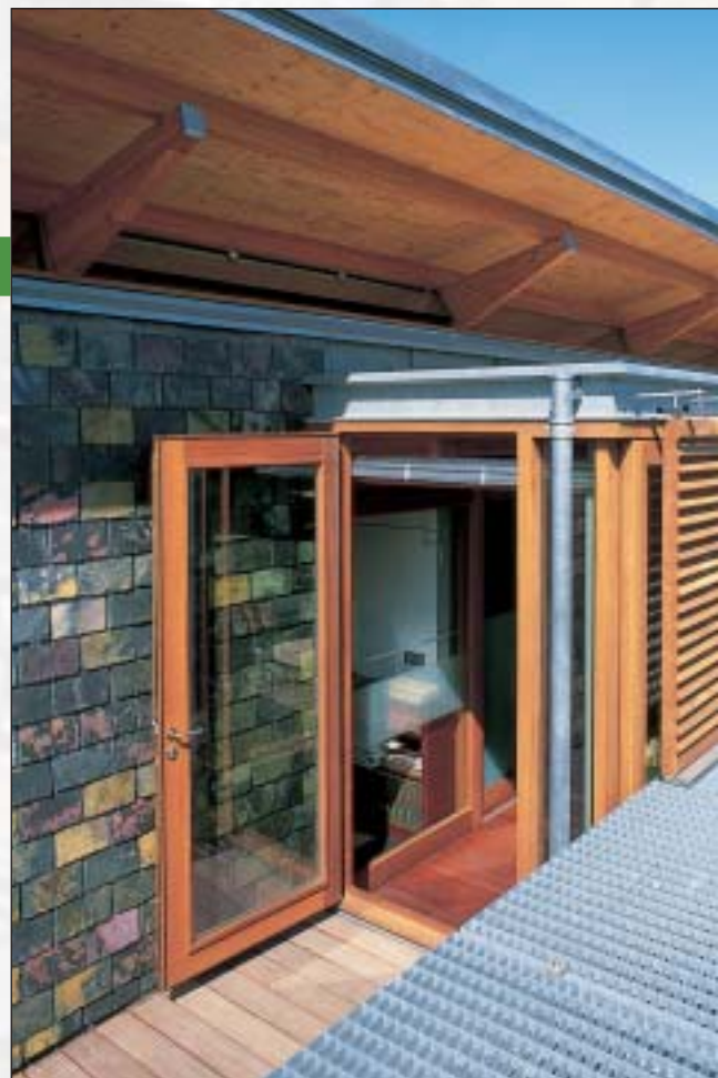
△ Bovenverdieping met iroko deuren en zonnelouvres. Het dak wordt gedragen door liggers en gordingen van Siberisch lariks.

Oud met nieuw combineren is voor Van Dijk bepaald geen experiment. Het is zelfs een van zijn specialiteiten. Dat is bijvoorbeeld duidelijk te zien aan zijn eigen woning in Horssen. De restauratie van deze 180 jaar oude boerderij heeft hij gecombineerd met nieuwe toevoegingen. Hierin zijn trappen, loopbrug en vloeren van de belangrijkste woonvertrekken van robijnhout