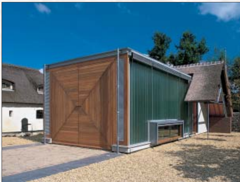
◁ De muziekvleugel met de enorme iroko taatsdeuren.

Dit bijgebouw, dat als carport en tuinberging dienstdoet, is bekleed met horizontale lariks delen van twee verschillende breedten, steeds een afwisseling van één brede en twee smalle. Dit thema werd eveneens toegepast bij het iroko. Het lessenaarsdak heeft een helling van 10° en is voorzien van gemoffelde golfplaatjes. De lariks delen zijn aan de boven- en onderzijde schuin afgefreest voor een optimale afwatering. Vanaf 2,30 m hoogte - de hoge kant van het gebouw is 4 m, de