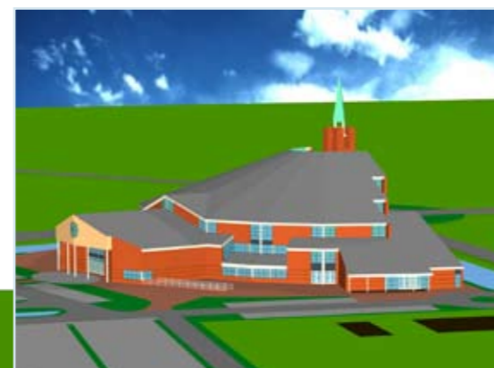
De nieuwe huisvesting van de Gereformeerde Gemeente in Nederland

OVERIG Heko Spanten, Ede; Schildersbedrijf Dijkwaard, Haften; Constructiebedrijf W. ten Ham, Ede