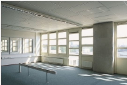
△ Interieur leslokaal.

De achterkant bestaat uit een nieuw werkplaatsencomplex, dat op begane-