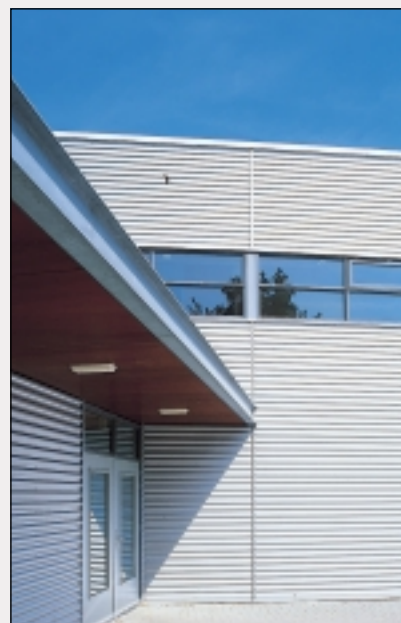
△ Detail werkplaatsencomplex. De architect heeft aan de gevels een technische uitstraling gegeven met zilverkleurige metaalplaat.

▷ Westgevel. Om de verbinding te symboliseren, kraagt het dak van de nieuwbouw voor een deel uit over het bestaande gebouw.