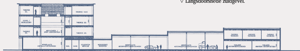
▽ Langsdoorsnede zuidgevel.