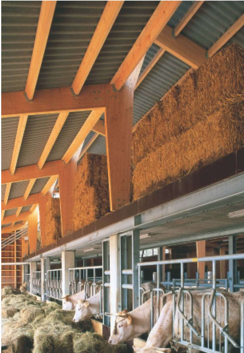
Afb. 2 Voorbeeld rundveestal (potstal in Doornspijk naar ontwerp van Alberts en Van Huut).