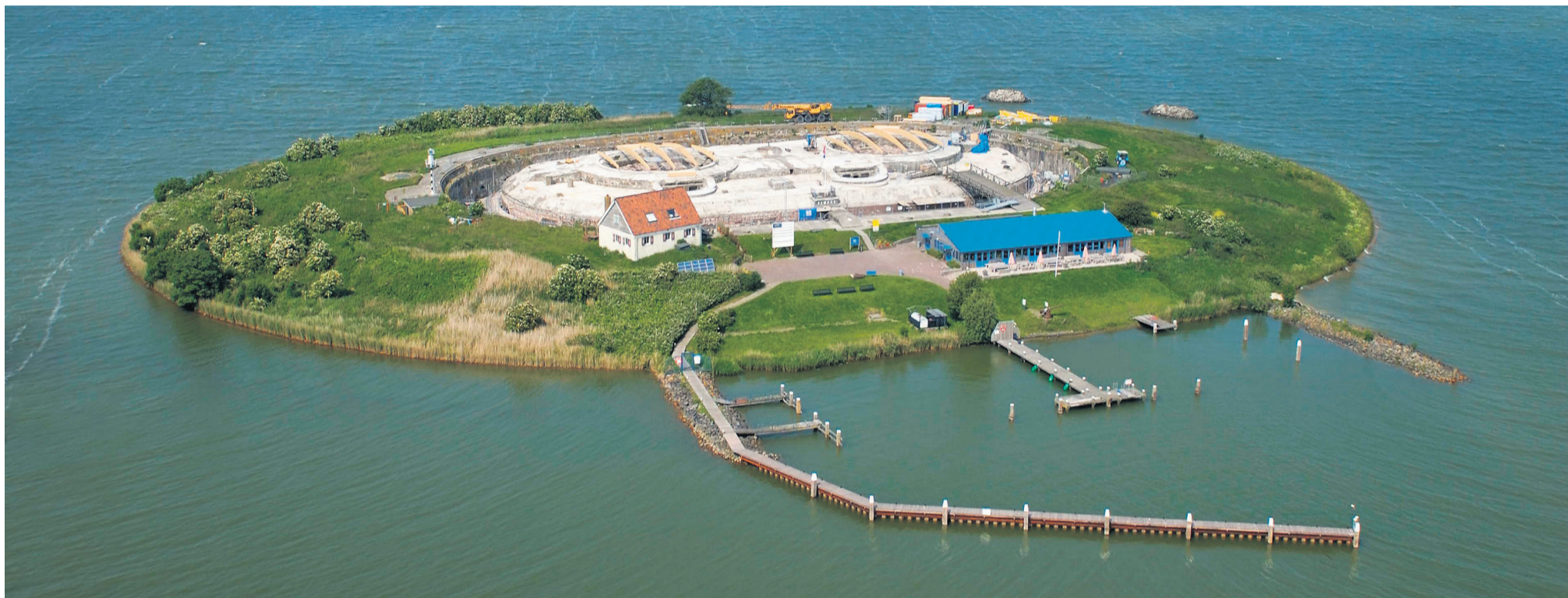
Naar het in de oorlog zwaar beschadigde binnenfort is zestig jaar niet omgekeken. Nu, na een jaar restaureren, heeft het fort weer zijn robuuste uitstraling.

Het sterk verwaarloosde binnenfort op Pampuseiland voor de monding van het IJ is gerestaureerd en vanaf deze week weer toegankelijk voor het publiek. De renovatie van het fort duurde ruim een jaar en kostte 1,3 miljoen euro.